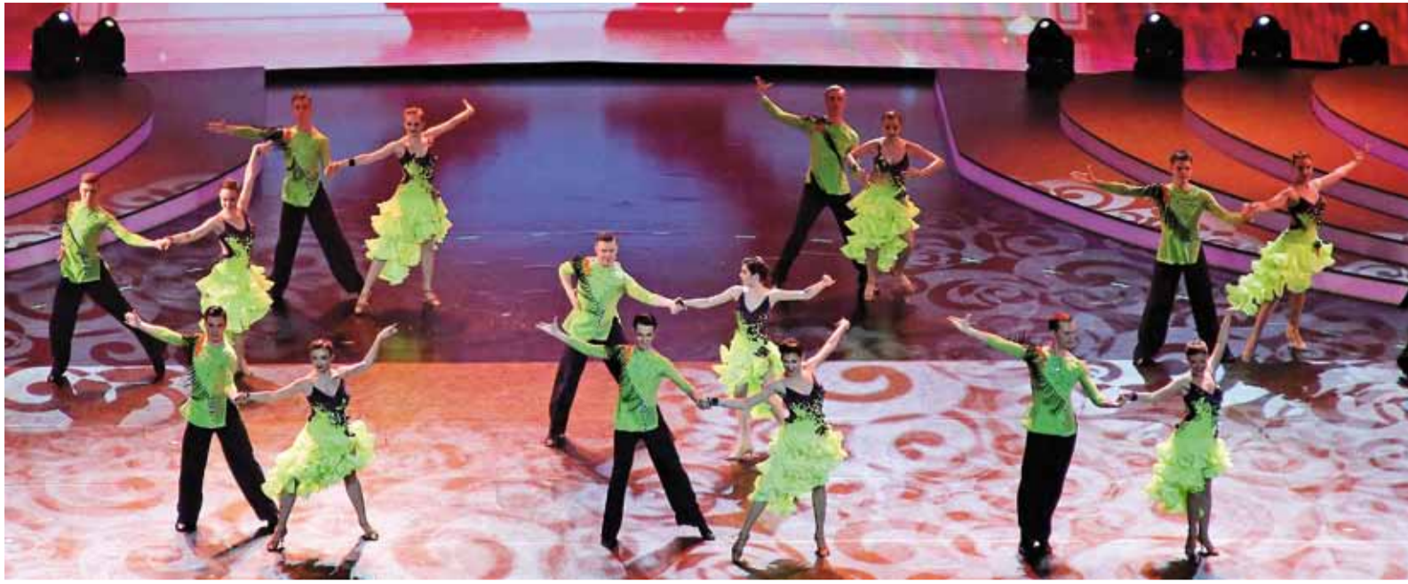
Солирует танцевальный коллектив «Музыка сердца»