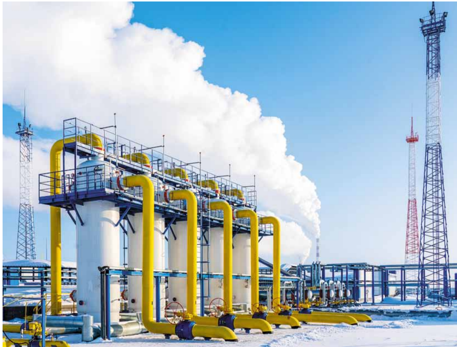
ГРС-1 (Александровское ЛПУМГ, Нижнеартовская промплощадка) – самая крупная газораспределительная станция России