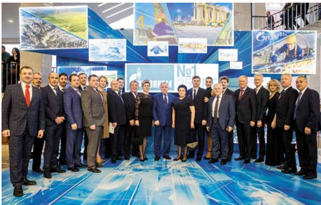
Делегация ООО «Газпром трансгаз Томск»