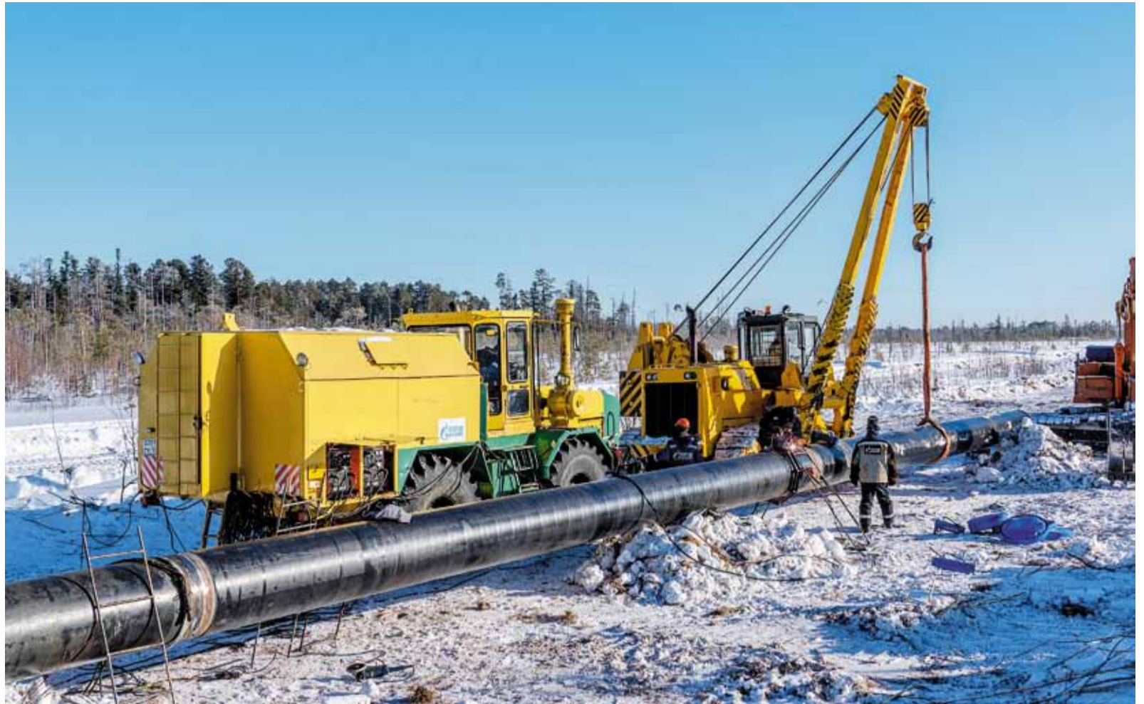
Ремонт газопровода будет продолжаться до апреля