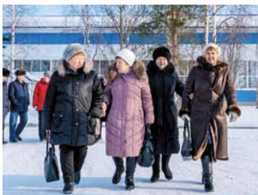
Ветераны промплощадки на родном предприятии