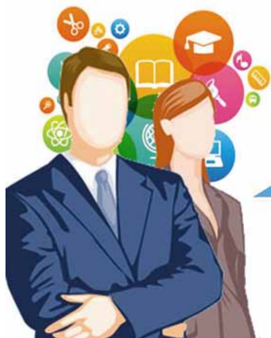
Статистика вопросов портала