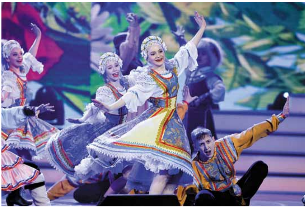
Детский коллектив «Веснушки»

Звучит торжественная музыка – начало юбилейного концерта. С огромного экрана к коллективу Газпрома обратился Президент Российской Федерации Владимир Путин: «Хочу отметить ту колоссальную работу, которая проделана вами по консолидации отрасли, ее сохранению и развитию. На протяжении многих лет, когда экономика страны была в тяжелом положении, она в значительной степени держалась именно на Газпроме, поскольку компания выдавала необходимый объем газа для поддержания нужных режимов в электроэнергетике и тепловой генерации и делала это по ценам явно ниже рыночных. За счет этого многие отрасли и предприятия могли перестраивать свою деятельность, вкладывать ресурсы в развитие. В минувшие годы Газпром выполнил огромную работу с точки зрения технологического обновления и расширения своих возможностей. Сегодня предприятие работает на 151 месторождении, в 34 странах мира, компания развивается не только внутри страны, увеличивая объемы газификации, но и поставляет значительную часть до-