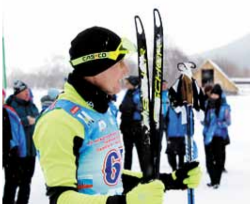
Губернатор Сахалинской области Олег Кожемяко