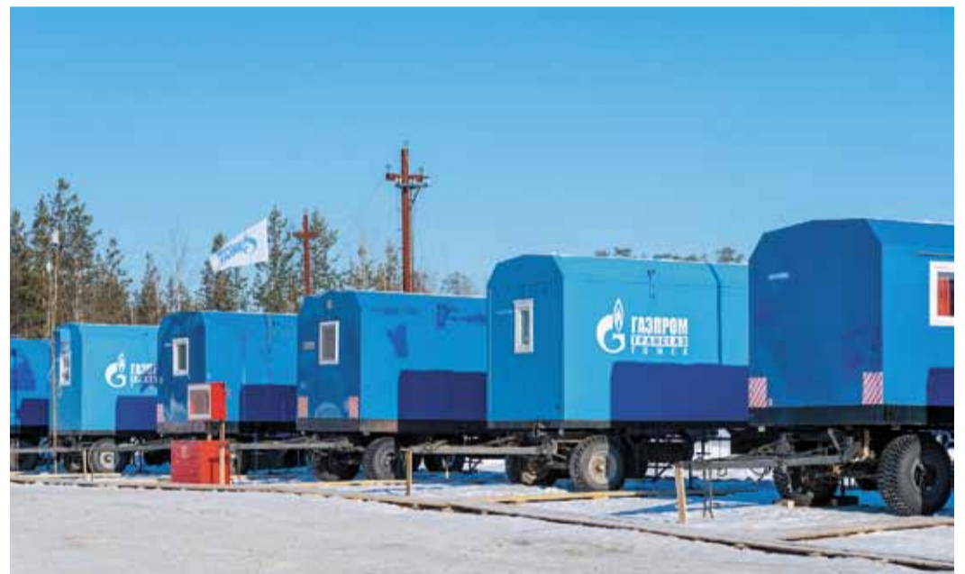
Вахтовый городок всегда отличается аккуратностью