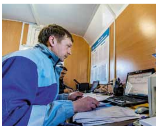
В новых вагончиках тепло и уютно

Сварка плетей на Мыльджино велась ручным электродуговым способом. Всего на трассе используются четыре поста: первый варит корневые швы, второй ведет заполнение стыка, третий – облицовочный слой, четвертый – подварочный слой трубы изнутри. При такой поточной системе время сварки сокращается почти в два раза – до двух часов.