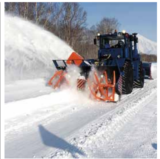
НОВАЯ СНЕГООЧИСТИТЕЛЬНАЯ ТЕХНИКА В КАМЧАТСКОМ ЛПУМГ

Парк автотехники Камчатского ЛПУ пополнился современным фрезерно-роторным снегоочистителем K-712 отечественного производства.