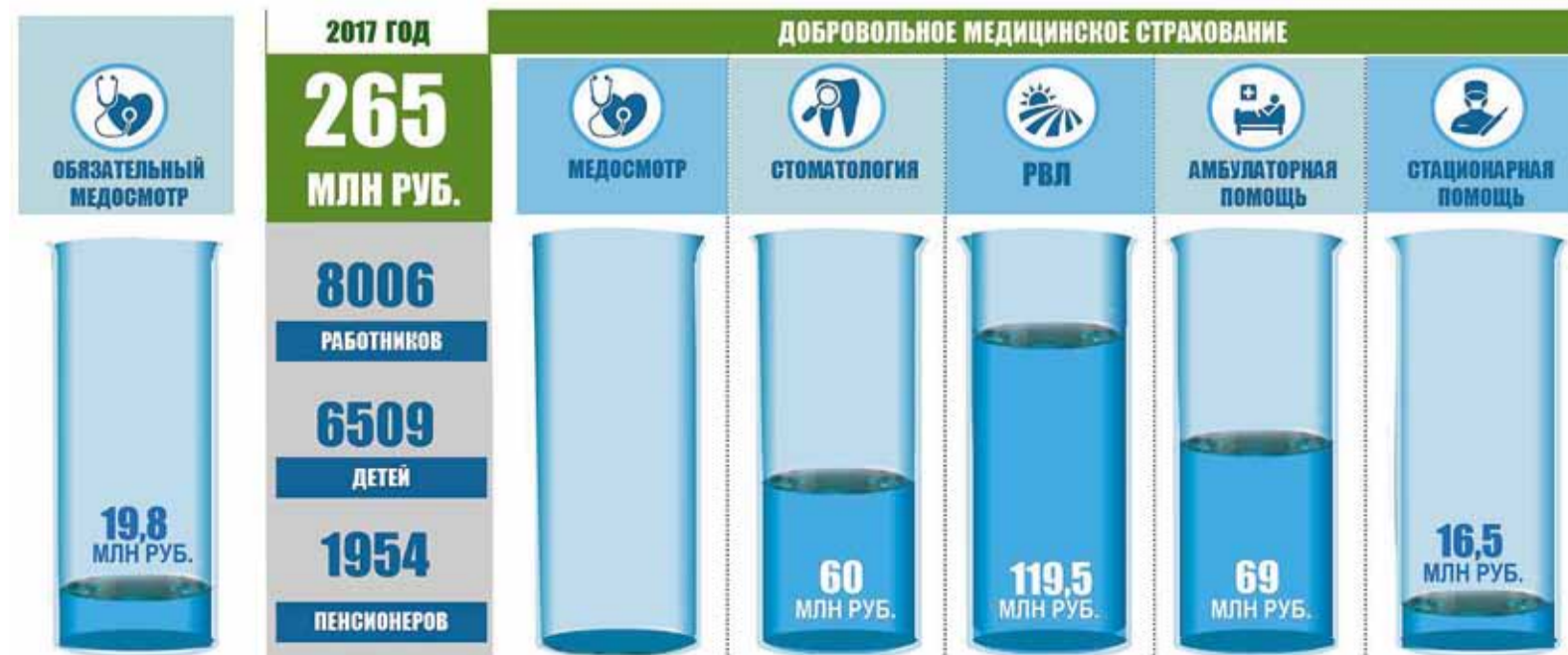
Затраты на медицинское обслуживание

Третий год в компании продолжает реализовываться программа медицинского страхования «Высокие медицинские технологии». В 2017 году были учтены пожелания работников, и в программу дополнительно вошли актуальные заболевания, такие как остеоартроз, остеохондроз, артрит и другие. Медицинская помощь была организована в 151 случае против 82 в 2016 году. Помощь оказывалась в том числе и федеральных медицинских центрах. В прошедшем году средняя стоимость про-