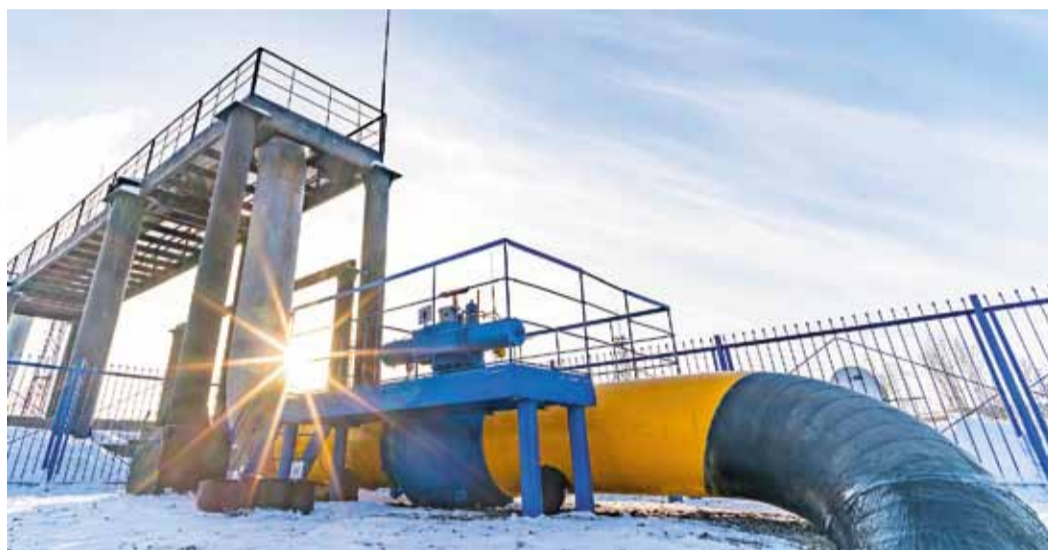
«Нулевой» километр газопровода НГПЗ – ПарABELь - Кузбасс